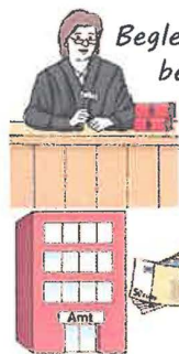
Begleitung zu Terminen bei Ämtern und Behörden