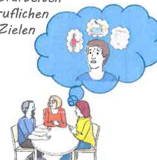
Gemeinsames Erarbeiten von realistischen, beruflichen und privaten Zielen