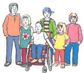
Unterstützung für die ganze Familie