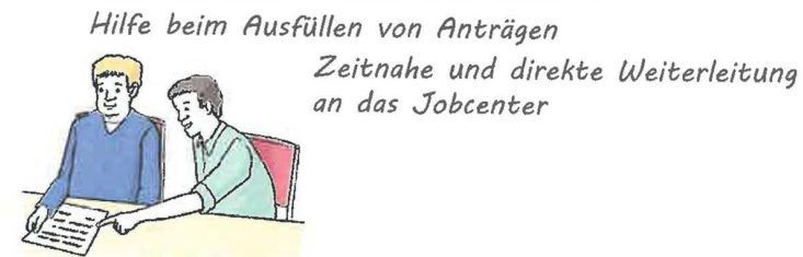
Hilfe beim Ausfüllen von Anträgen Zeitnahe und direkte Weiterleitung an das Jobcenter