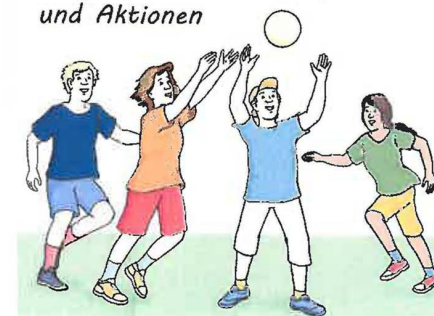
Ausflüge, Veranstaltungen und Aktionen