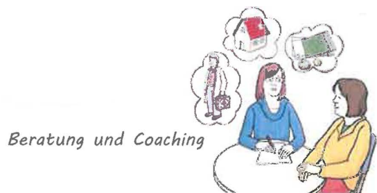
Beratung und Coaching