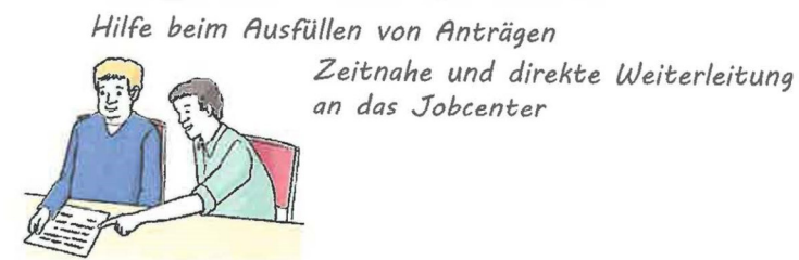
Hilfe beim Ausfüllen von Anträgen Zeitnahe und direkte Weiterleitung an das Jobcenter