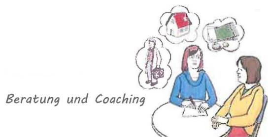
Beratung und Coaching