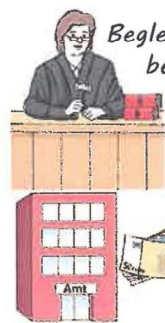
Begleitung zu Terminen bei Ämtern und Behörden